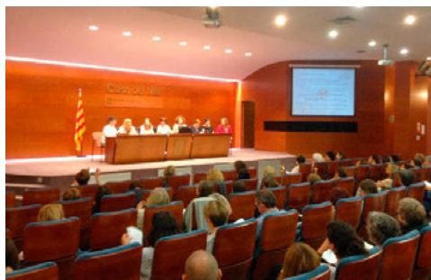
Presentación de los Comités de Ética: 7 diferentes visiones