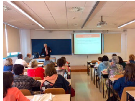
El Dr. Lailla en la sesión ¿Hay límites a la Maternidad? Maternidad subrogada a debate

Este curso ofrece un espacio en el que se abordan, desde la ética, las principales temáticas de actualidad en el mundo sanitario.