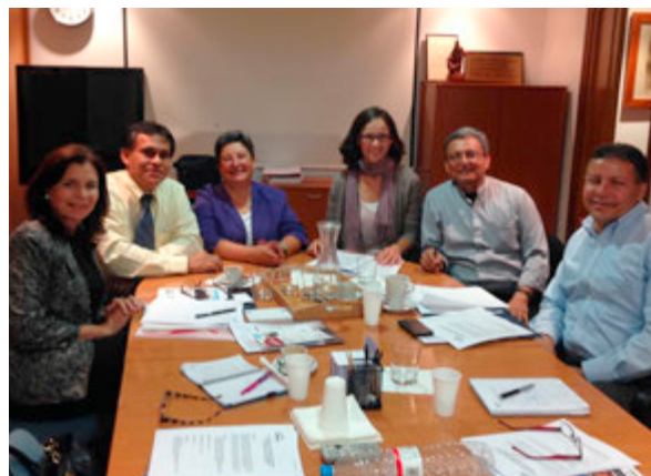
Integrants de la Universitat Centreamericana (UCA) i de l'IBB en la sessió de treball

El conveni de col·laboració entre ambdues entitats vol desenvolupar cursos i títols en Bioètica a partir de 2016, promovent l'intercanvi acadèmic i cultural d'estudiants, docents i investigadors.