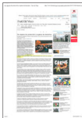
Faro de Vigo, 5 d'octubre de 2015

ajudar, tant a professionals, com a famílies a prendre decisions al final de la vida" (M. Esquerda).