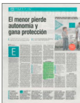
Diario Médico, 21 de setiembre de 2015

Médicos y pacientes, revista digital de l'Organización Médica Colegial, va publicar l'article d'opinió de la Dra. M. Esquerda La toma de decisiones en menores, entre sujetos de derecho y objetos de protección.