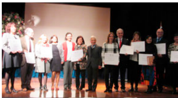
Acte de graduació de la 2ª promoció del Magíster Interuniversitari de Bioètica

9 de juliol de 2015. Facultat de Medicina, Universidad del Desarrollo, Xile.