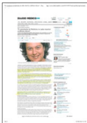
Diario Médico.com, 7 de setembre de 2015