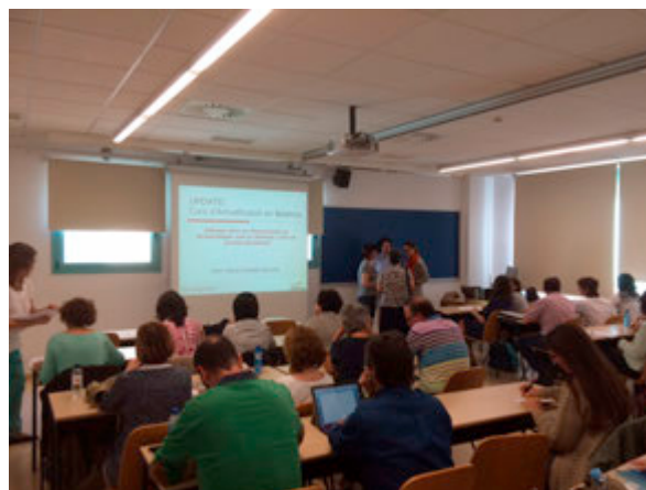
A punt de començar a l'aula Dilemes ètics en finançament en farmacologia

El primer Curs d'actualització va comptar amb 50 inscrits de molt variat perfil professional.