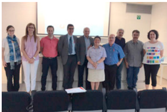
Els ponents de la jornada de Bioètica