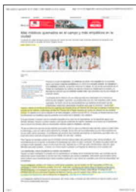
La Vanguardia, 9 de setembre de 2015