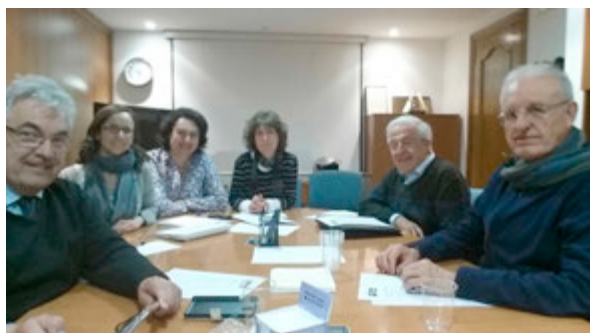
Reunió del Consell de Redacció de la revista