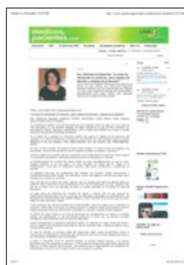
medicosypacientes.com., 16 d'octubre de 2015