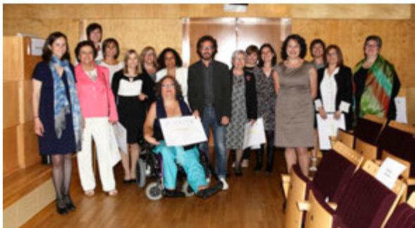
El Grup d'alumnes graduats amb les noves directores de l'IBB

Seguidament es va procedir a l'acte acadèmic de graduació amb el lliurament dels títols als graduats i graduades de la 9ª promoció del Màster en bioètica (2011-2013)..